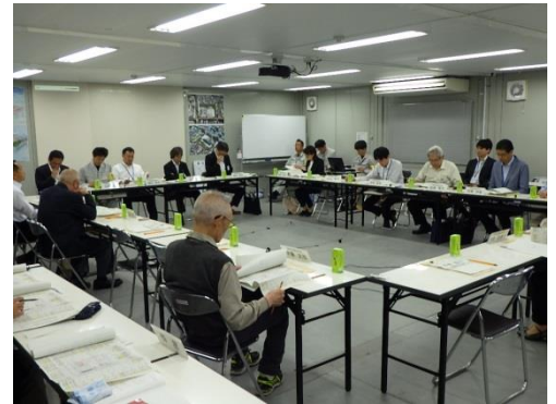
(第7回建替協議会の様子)

目黒清掃工場建替協議会では、工場の建替えに関する情報を提供するとともに、建替工事に関して地域の皆さまからご意見をいただき、円滑な事業運営に努めています。